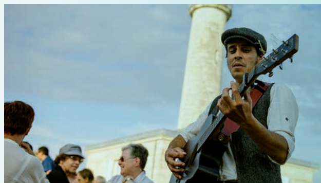
Nuit des carrefers, Phare de Richard, Jau-Dignac-et-Liorac

Mais au-delà de la découverte et de la valorisation du territoire, la culture doit œuvrer à la construction d'un vivre-ensemble harmonieux.