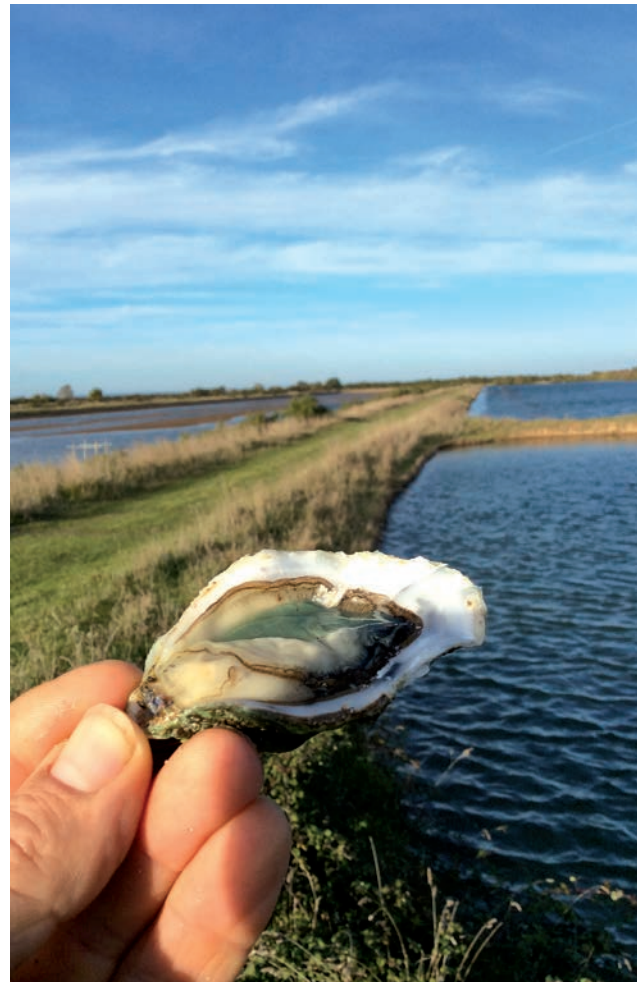
Huître, marais de Saint-Vivien-de-Médoc

En juillet 2014, le Préfet signe l'arrêté autorisant l'affinage des huitres dans les marais du Nord Médoc. Quelques producteurs se sont ainsi installés s'ajoutant aux aquaculteurs déjà présents qui ont pu diversifier leur activité. La filière médocaine est en cours de structuration et envisage la création d'une IGP. Le Pnr s'associe activement à cette démarche, notamment en proposant les outils de valorisation des produits à sa disposition (ex : marque "Valeurs Pnr").