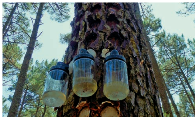
Gemmaison, Le Forge

Aussi, est-il nécessaire de favoriser l'innovation dans ces domaines en explorant de nouvelles perspectives de développement, valorisant les ressources et savoir-faire locaux.