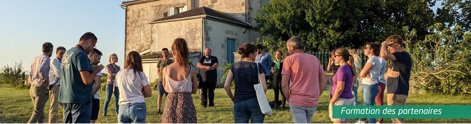
Formation des partenaires